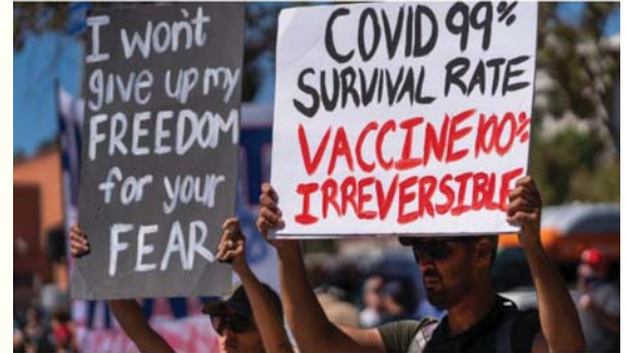
Protesters opposing COVID-19 vaccine mandates hold a rally in front of City Hall in downtown Los Angeles.